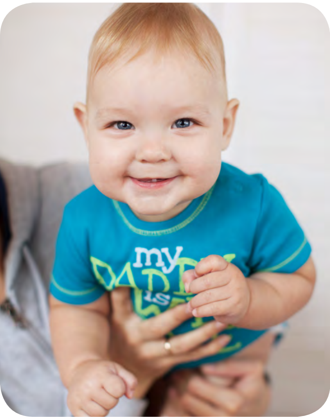
Bekleidung für Babys ab 0 Jahren