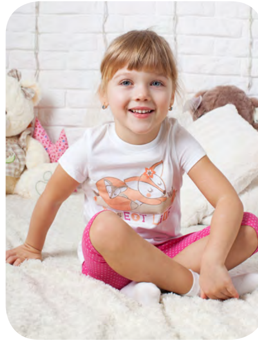
Unterwäsche und Nachtwäsche